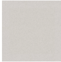
White 60x60 ZLS5 Mate ZLS0 Brillante