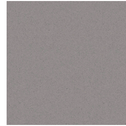
Gray 60x60 ZLS6 Mate ZLS8 Brillante