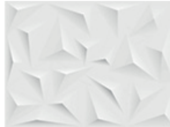
Origami blanco ZPR2